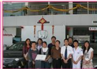
学生实习就业回访