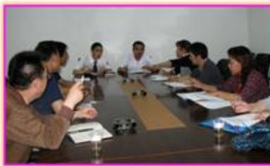
行业企业专业调研

深入本地区各类型企业进行实地考察观摩、与企业专家座谈，全方位了解企业岗位设置、岗位要求、岗位职责、工作任务、人才需求（数量、规格、薪酬、晋升途径等等）；通过深入企业与毕业生面谈、电话追询，问卷调查等了解毕业生就业企业、就业岗位分布、建议与需求等情况；与企业专家共同构建汽车运用与维修技术专业基于工作过程系统化的课程体系。