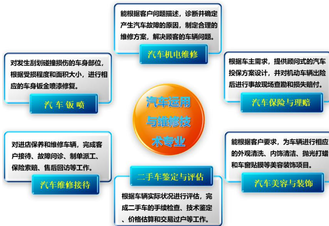
汽车运用与维修技术专业就业岗位