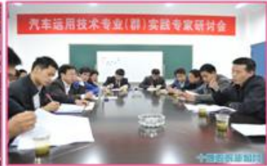
实践专家交流研讨